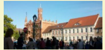
Und was soll ich dort?

Diese und ähnliche Fragen stellte ich mir im Jahr 2008, als ich im Internet die passende Immobilie für mich und meinen Mann entdeckte.